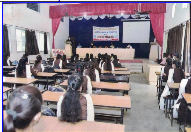
Students are civilized in the program on Women's Empowerment