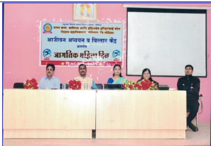
Hon'ble Gueste are positioned on the dais